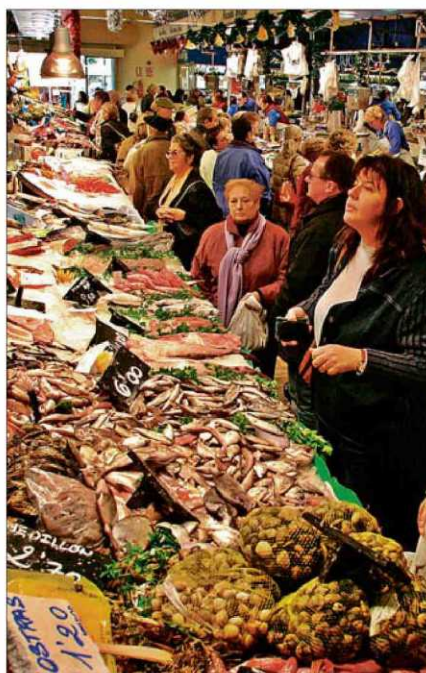
Imagen del Mercat de l'Olivar. M.M.

Ellas gastan con la tarjeta una media de 2.000 euros anuales en conceptos relacionados con el hogar; los hombres, 1.146