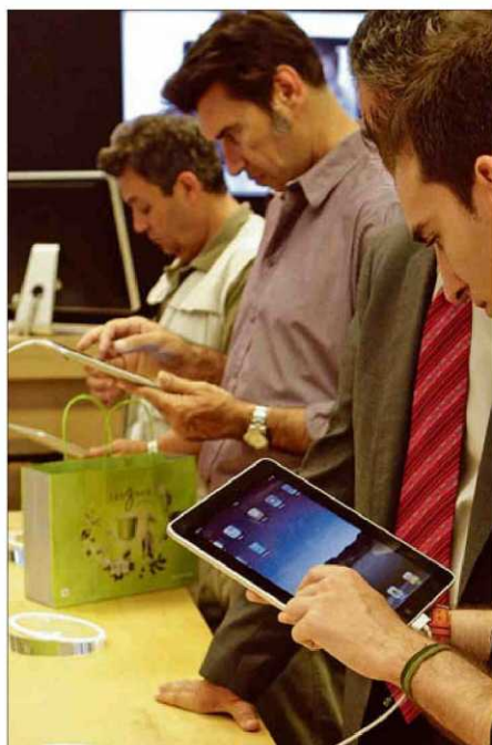
Clientes mirando iPads en un comercio de Palma. M.M.

¿En qué gastan ellos? Tiran de tarjeta en coches, bares, restaurantes, tecnologías y transporte: conceptos que suponen más del 50% del gasto de los varones, frente al 22% de las transacciones de las mujeres. Así, los hombres gastan una media de 1.339 euros