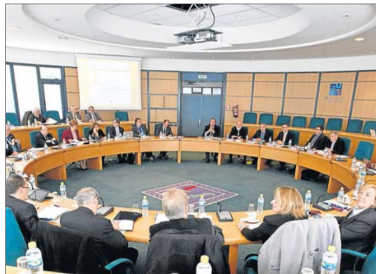
Especialistes de diferents àmbits han participat a la jornada.