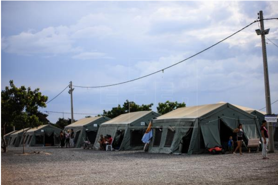
Imagen de archivo de un albergue para refugiados.