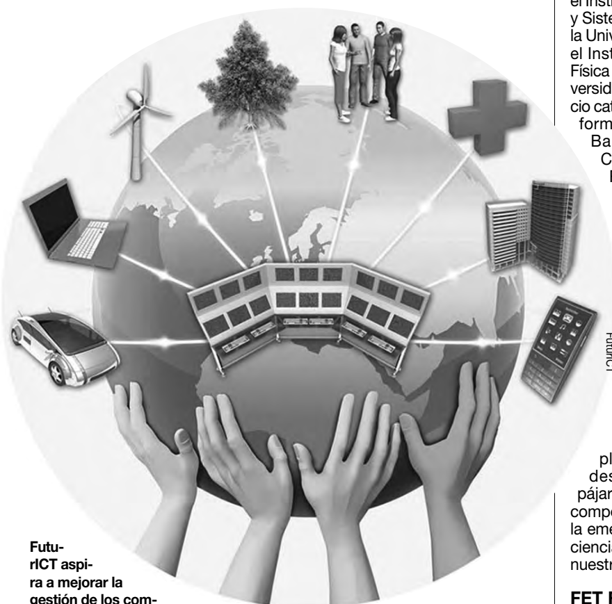
FuturICT aspira a mejorar la gestión de los complejos problemas globales que afectan a la sociedad mediante el uso de las herramientas de la ciencia.

Todo ello requiere el uso de infraestructuras de supercomputación, de la metodología del estudio de sistemas complejos en el nuevo esquema de Ciencias Sociales Computacionales, el des-